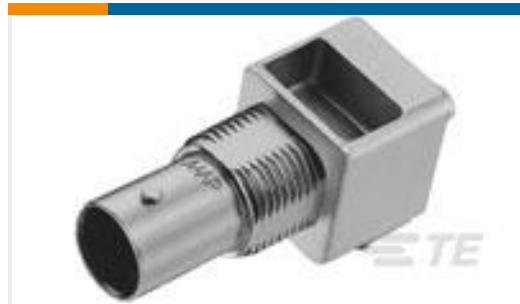
TE 产品编号227677-1 BNC PCB RT ANG JACK W/POST