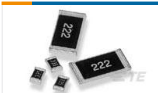
TE 产品编号1623460-1 CRG1206 1% 220R