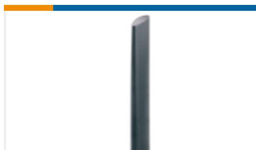
TE 产品编号ANT-LTE-WS-SMA Antenna Blade NBIOT LTE-M Swivel SMA