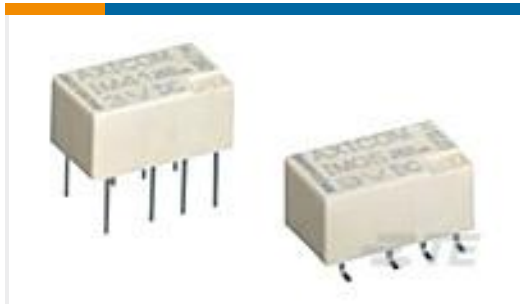
TE 产品编号1-1462038-7 IM07NS=IM RELAY 200mW 24V