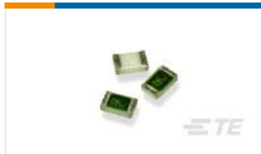
TE 产品编号2-1614884-0 CPF 0805 13R 0.1% 25PPM 1K RL