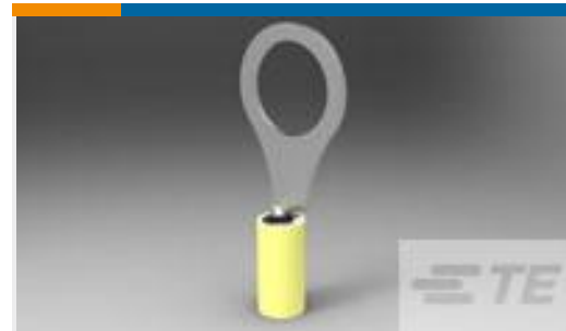
TE 产品编号35346 TERMINAL,PIDG R 12-10 5/16