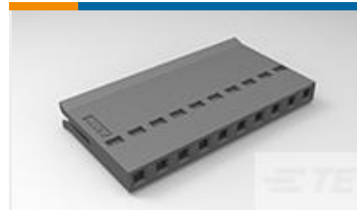
TE 产品编号487378-6 007 HOUSING FFC RCPT 100CL SR