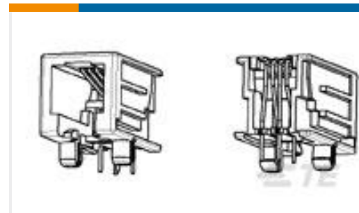
TE 产品编号1-1705950-2 Modular Jack SE, 6/4, Gold flash