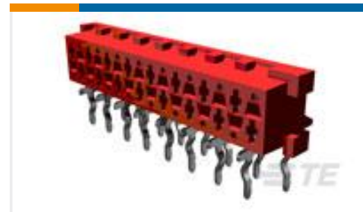
TE 产品编号215460-4 MICRO-MATCH FEM.SE