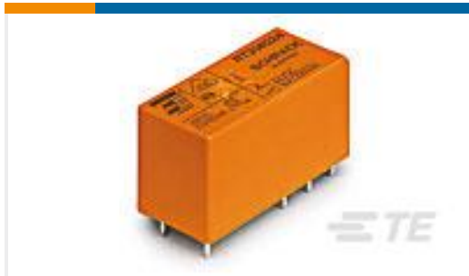
TE 产品编号2-1415898-5 RTS3LF12