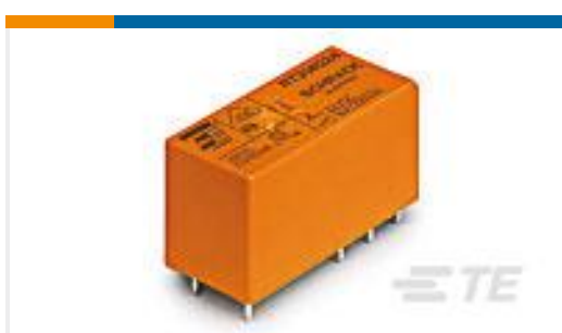
TE 产品编号4-1393243-7 RT424A24