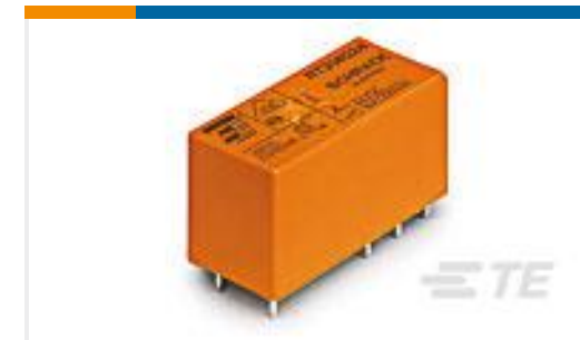
TE 产品编号3-1419136-9 RT31LA06