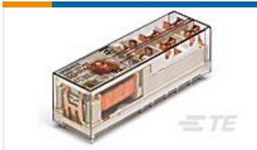
TE 产品编号6-1415537-5 SR6A6K24