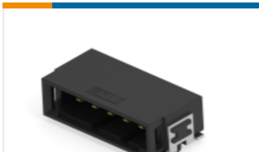
TE 产品编号254823-E SRCA 2,54 5 M 1 SMD 137 E1 094 * GURT *