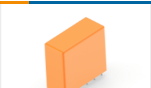
TE 产品编号4-1393235-7 RP821F606