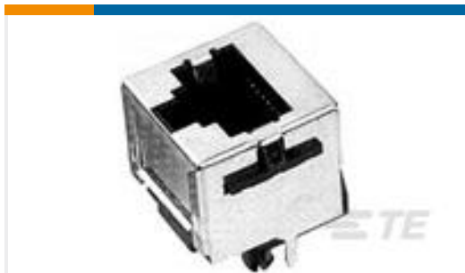
TE 产品编号3-1734577-1 MOD-JK,8P8C,SHD W/O LED, 6u" A