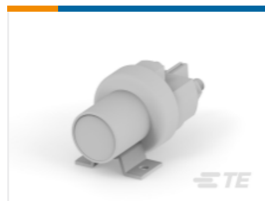
TE 产品编号K1008699 Relay 26-60-05