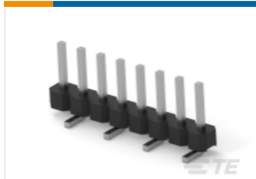
TE 产品编号2842104-8 8P,2MM,BRK HDR,SRVT,SMD,0.76AU, TR W/CAP