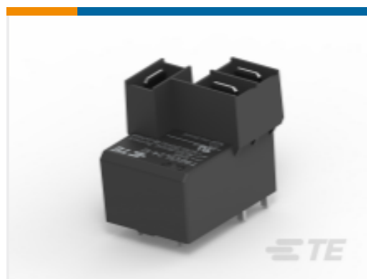
TE 产品编号1558676-6 T9GS1L24-22