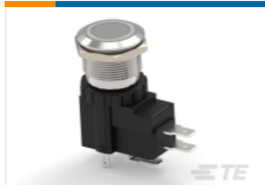
TE 产品编号2-2364570-8 AVH19 FLT SS LK RNG R&B 24V16A