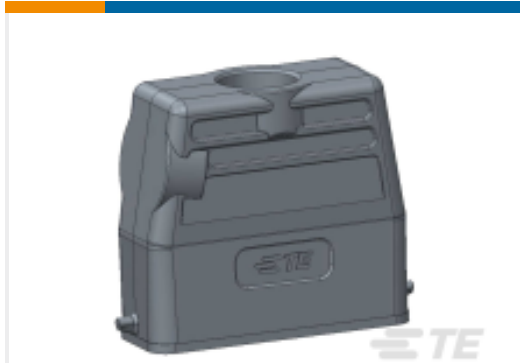
TE 产品编号T1349160120-000 H16A-TGH-M20