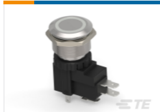
TE 产品编号1-2364686-5 AVH22 FLT SS MT RNG GRN 24V16A