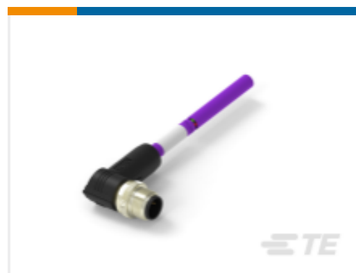
TE 产品编号TAB62246501-040 M12B2-MR-PUR TORSION-4.0M