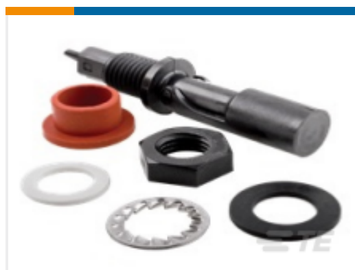
TE 产品编号80645-000 LS809-51 Liquid Level Sensor