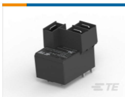
TE 产品编号1558676-6 T9GS1L24-22