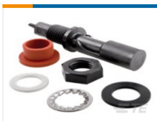
TE 产品编号80645-000 LS809-51 Liquid Level Sensor