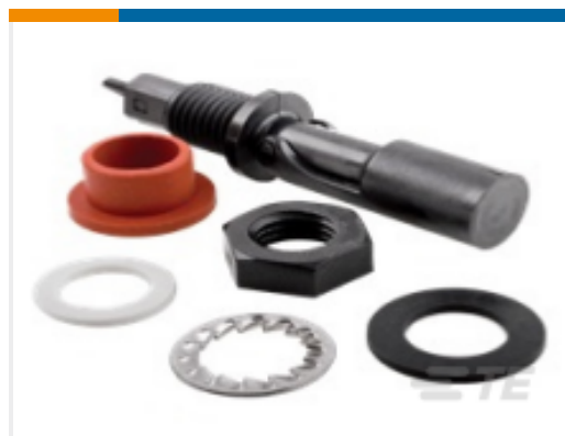
TE 产品编号80645-000 LS809-51 Liquid Level Sensor