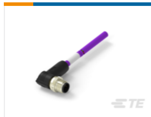
TE 产品编号TAB62246501-040 M12B2-MR-PUR TORSION-4.0M