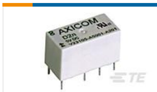
TE 产品编号1393793-9 V23105A5405A201