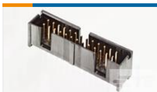
TE 产品编号5103308-1 A/L LOW PRO HDR 10P VERT BLACK