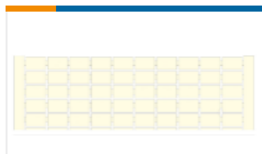
TE 产品编号1SNA233141R2600 RC610 1->50 (X2) HORIZONTAL