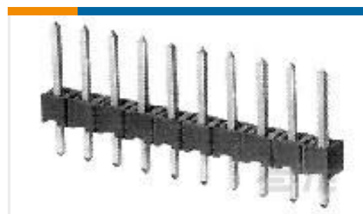
TE 产品编号5-826629-0 50P AMPMODU II PIN HDR.