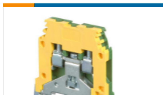
TE 产品编号1SNA165488R2700 MA2.5/5.P