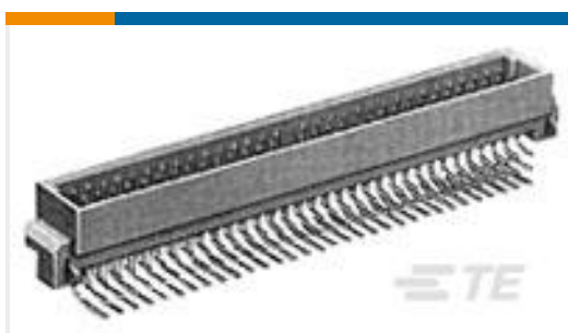
TE 产品编号5650906-5 ASSY, PIN, EUROCARD, TYPE C, LEAD-