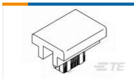
TE 产品编号91348-1 SEATING TOOL, HMZD HDR, 2 PAIR