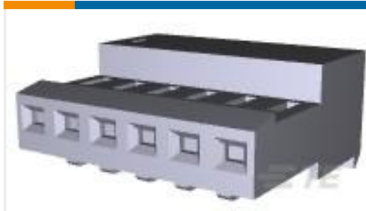
TE 产品编号3-640441-6 06P MTA100 CONN ASSY WHT