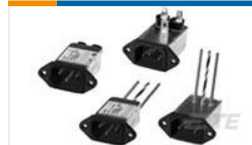
TE 产品编号1-6609016-1 6ED1C=F7066 S0