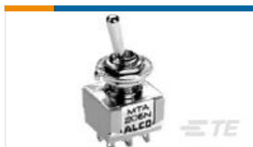
TE 产品编号1-1437559-1 MTG106D=(MSTG) SW TOG MUSTANG