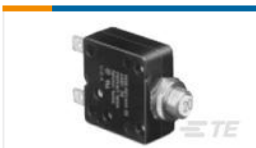
TE 产品编号1-1393249-1 W58-XB1A4A-2=W58