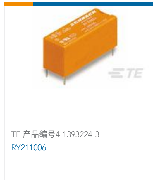
TE 产品编号4-1393224-3 RY211006