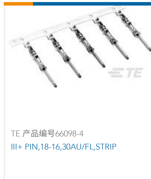
TE 产品编号66098-4 III+ PIN,18-16,30AU/FL,STRIP