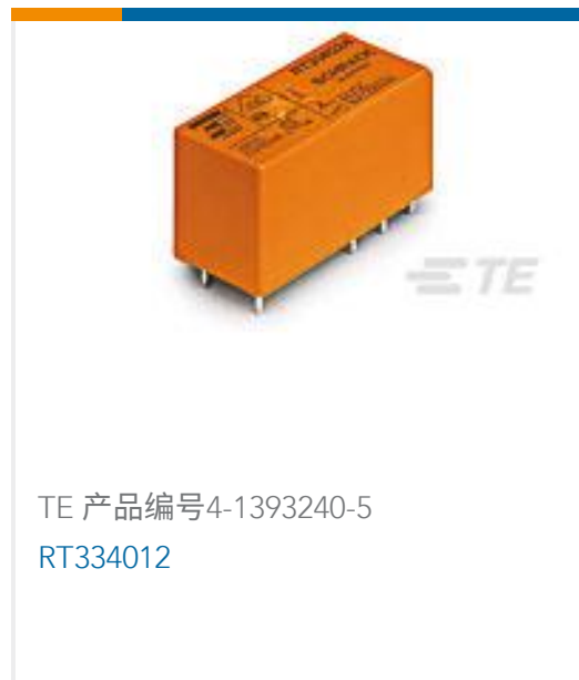
TE 产品编号4-1393240-5 RT334012