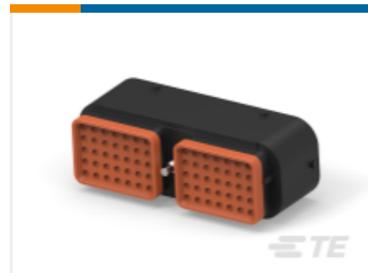
TE 产品编号DRC16-70SBE-P013UK PLG, 70P, BLK, E, SEAL BOND, B