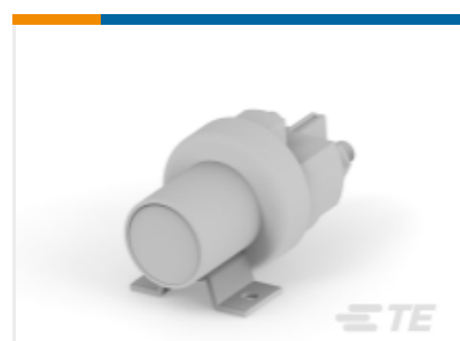
TE 产品编号K1008699 Relay 26-60-05