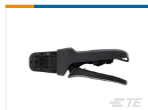
TE 产品编号DTT-20-03 CRIMP TOOL