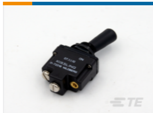
TE 产品编号K1007153 Toggle Switch 08-1-1-13