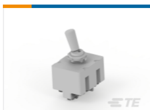
TE 产品编号K1002956 Toggle Switch 08-4-1-13