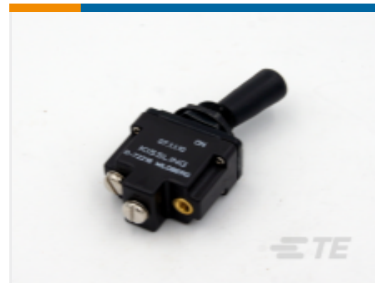
TE 产品编号K1007153 Toggle Switch 08-1-1-13