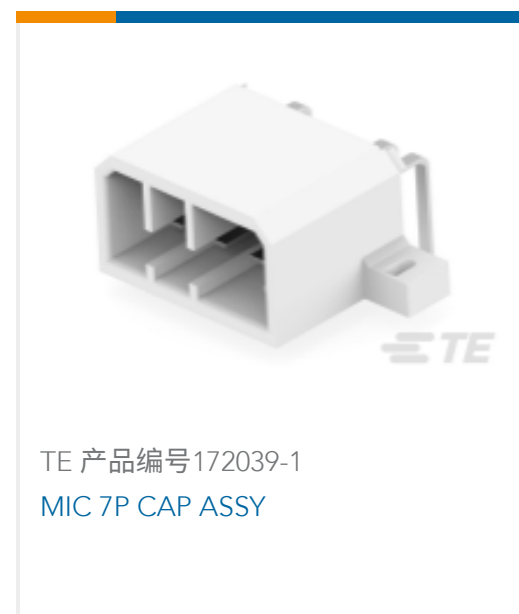
TE 产品编号172039-1 MIC 7P CAP ASSY