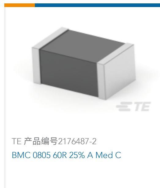
TE 产品编号2176487-2 BMC 0805 60R 25% A Med C