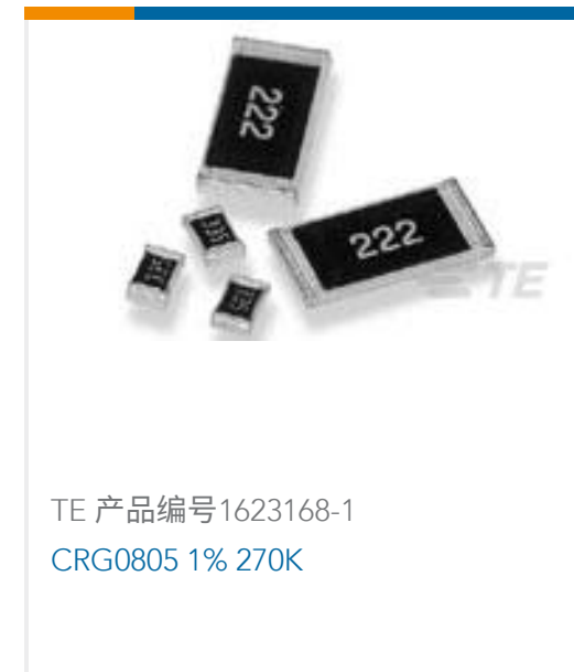
TE 产品编号1623168-1 CRG0805 1% 270K