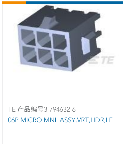
TE 产品编号3-794632-6 06P MICRO MNL ASSY,VRT,HDR,LF