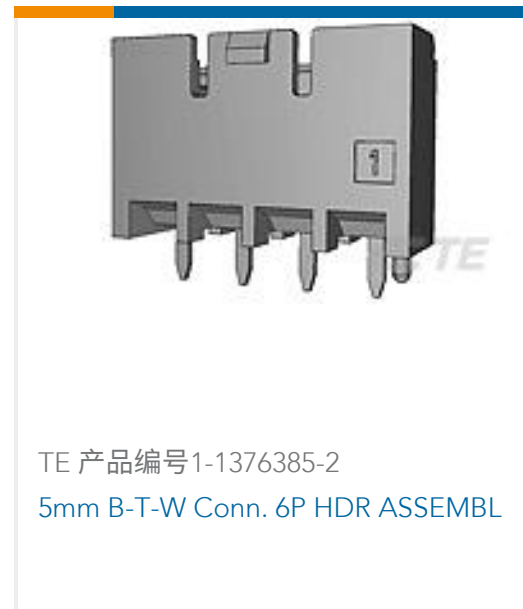
TE 产品编号1-1376385-2 5mm B-T-W Conn. 6P HDR ASSEMBL