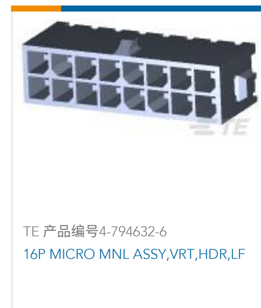
TE 产品编号4-794632-6 16P MICRO MNL ASSY,VRT,HDR,LF