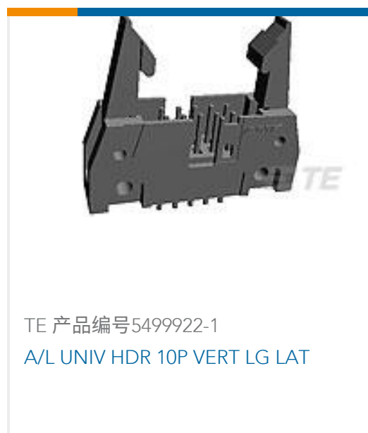
TE 产品编号5499922-1 A/L UNIV HDR 10P VERT LG LAT