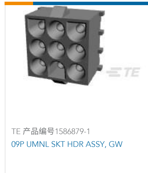
TE 产品编号1586879-1 09P UMNL SKT HDR ASSY, GW