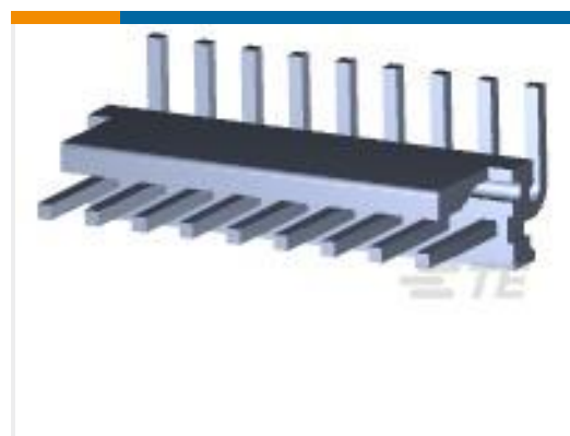
TE 产品编号640387-9 09P MTA156 HDR ASSY SQ R/A