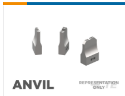
TE 产品编号2-904717-2 ANVIL, COMBINATION