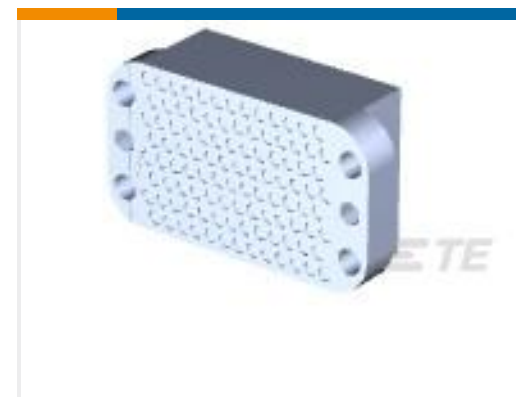
TE 产品编号201345-1 104 PL. MALE BLOCK-PHEN.