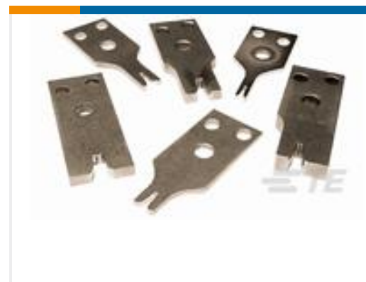
TE 产品编号1-456403-5 CRIMPER WIRE .062 F