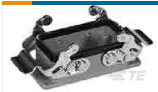
TE 产品编号1102291-9 HB.24.AG-LB