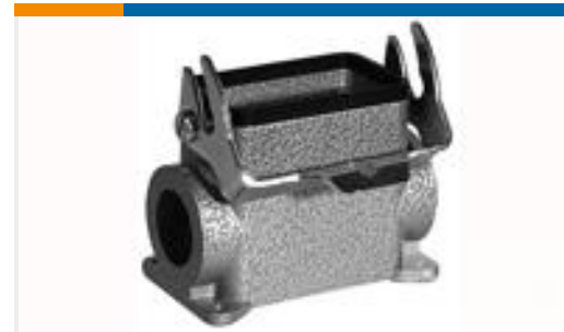
TE 产品编号1-1106451-3 HD.40.SG-LB.2.M32.Z+BS