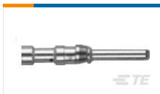
TE 产品编号1-1105300-1 HVT-C-Sti.Ag.0,5 qmm