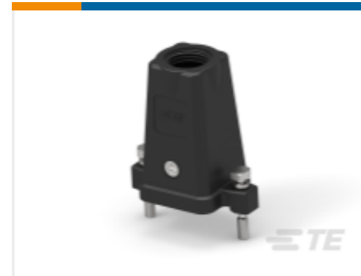
TE 产品编号T1926030116-009 H3APR-TGC-M16-EMC-C