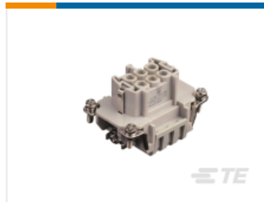
TE 产品编号T2040064201-000 HE-006-FC