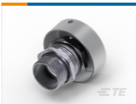
TE 产品编号T3900250250-000 M25X1.5 VA-25-LM