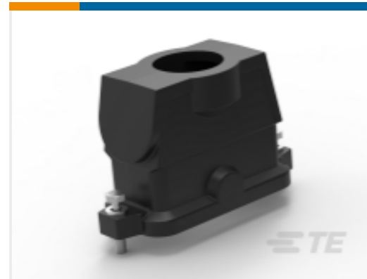
TE 产品编号T1922160140-000 H16BPR-TGHC-M40