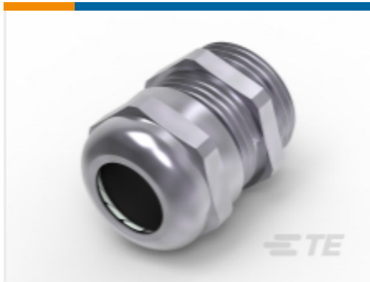
TE 产品编号T3609200102-000 DLX-20-M