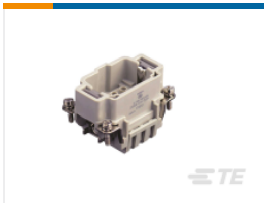
TE 产品编号T2040064101-000 HE-006-MC