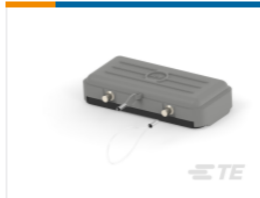
TE 产品编号T1010161600-000 H16B-KDTP-BO