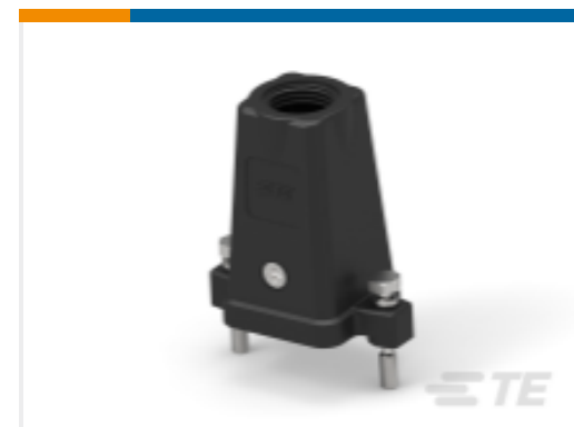
TE 产品编号T1926030116-009 H3APR-TGC-M16-EMC-C