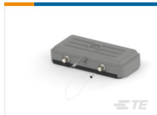
TE 产品编号T1010161600-000 H16B-KDTP-BO