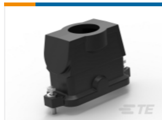
TE 产品编号T1922160140-000 H16BPR-TGHC-M40