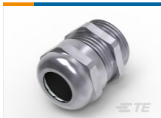
TE 产品编号T3609200102-000 DLX-20-M