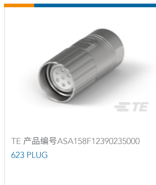
TE 产品编号ASA158F12390235000 623 PLUG