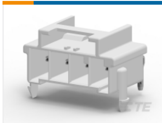
TE 产品编号1-1969694-4 PTL 1X4 PCB HEADER R/A HITEMP KEY A LGR