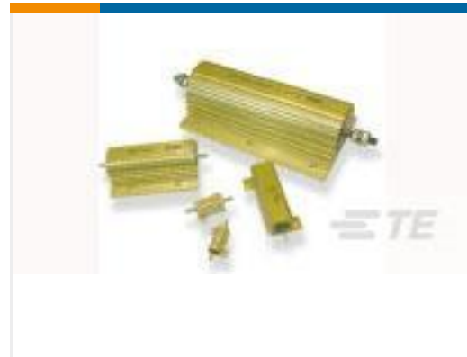
TE 产品编号1-1630019-4 HSC200 2K4 5%