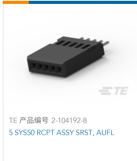
TE 产品编号 2-104192-8 5 SYS50 RCPT ASSY SRST, AUFL