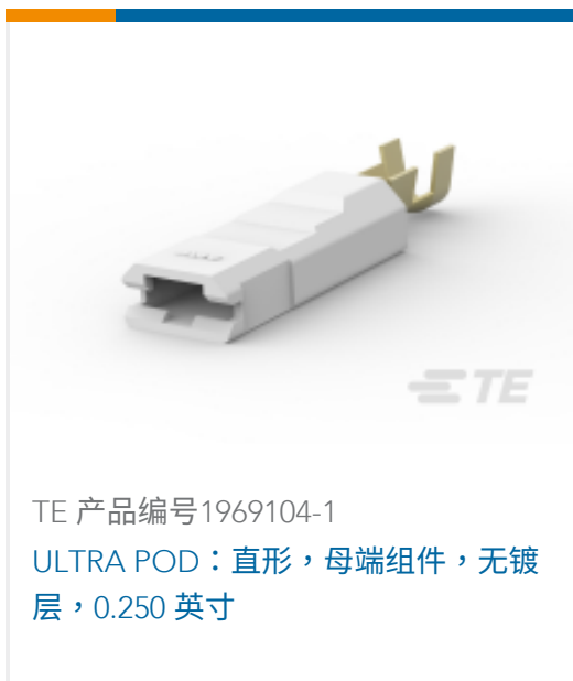
TE 产品编号 1969104-1 ULTRA POD: 直形, 母端组件, 无镀层, 0.250 英寸