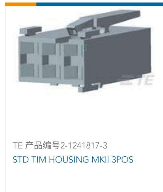
TE 产品编号 2-1241817-3 STD TIM HOUSING MKII 3POS