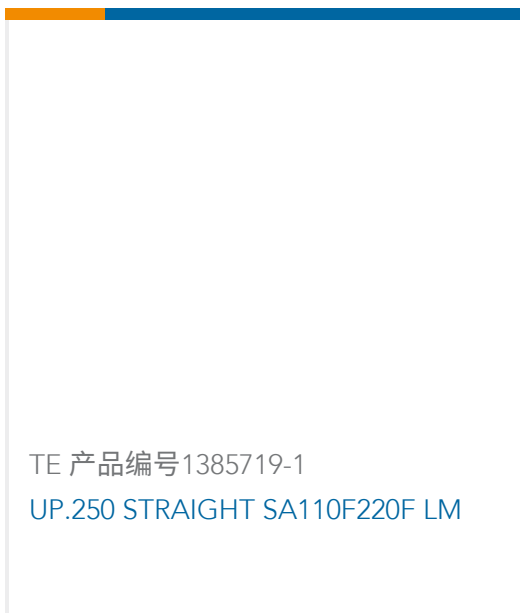
TE 产品编号 1385719-1 UP.250 STRAIGHT SA110F220F LM