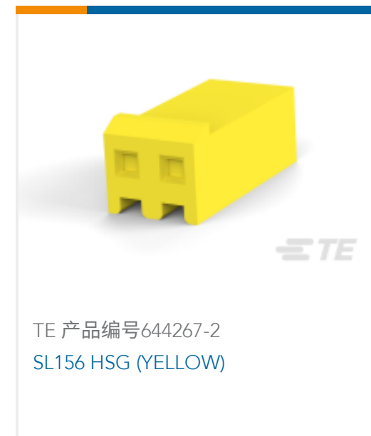
TE 产品编号 644267-2 SL156 HSG (YELLOW)