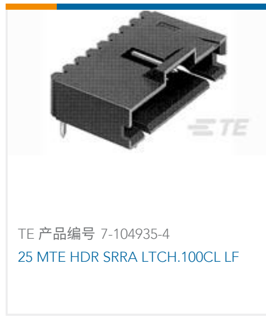
TE 产品编号 7-104935-4 25 MTE HDR SRRA LTCH.100CL LF