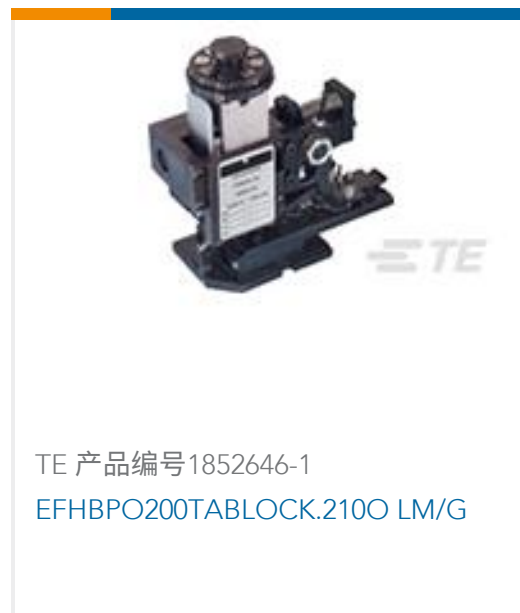
TE 产品编号 1852646-1 EFHBPO200TABLOCK.2100 LM/G