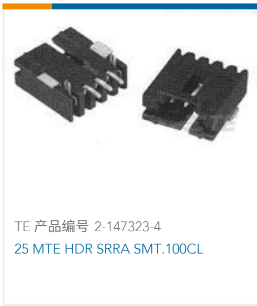
TE 产品编号 2-147323-4 25 MTE HDR SRRA SMT.100CL