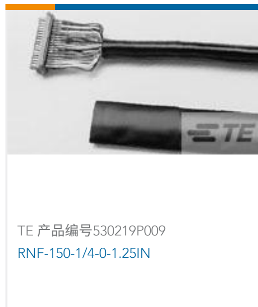
TE 产品编号 530219P009 RNF-150-1/4-0-1.25IN