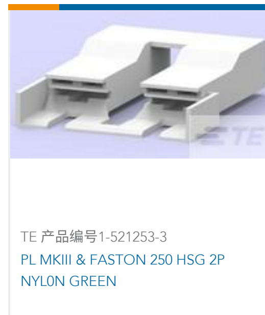
TE 产品编号 1-521253-3 PL MKIII & FASTON 250 HSG 2P NYLON GREEN