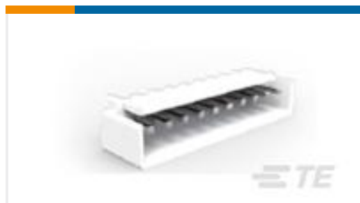
TE 产品编号1744427-6 EP Header Asy,Shrouded,6 Pos, GW