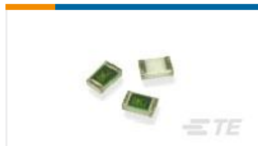
TE 产品编号1-2176087-5 RP 1J 0.166W 95R3 0.1% 25PPM 1K RL