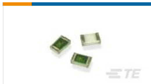
TE 产品编号6-1625867-9 RP 1J 0.166W 32R4 0.1% 25PPM 1K RL