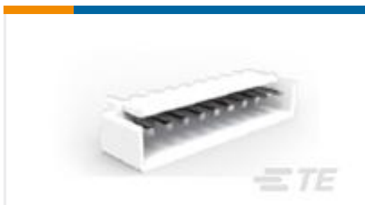
TE 产品编号1-1744427-2 EP Header Asy,Shrouded,12 Pos, GW