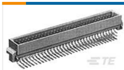
TE 产品编号5650949-5 ASSY,PIN,EUROCARD,TYPE C,LEAD-FREE,120 P