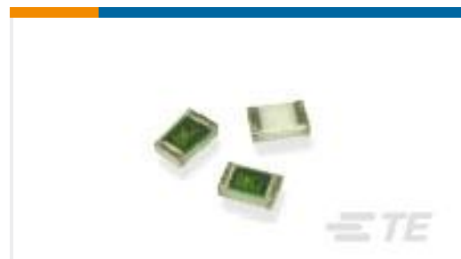
TE 产品编号9-1625867-1 RP 1J 0.166W 54R9 0.1% 25PPM 1K RL