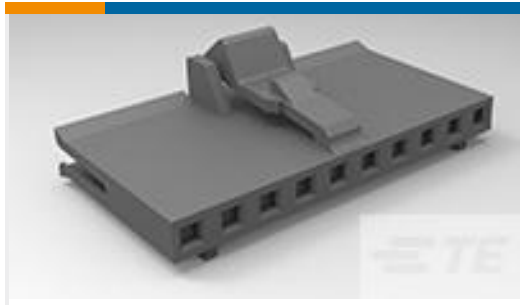
TE 产品编号 2-487526-3 024 HOUSING FFC RCPT 100CL SR