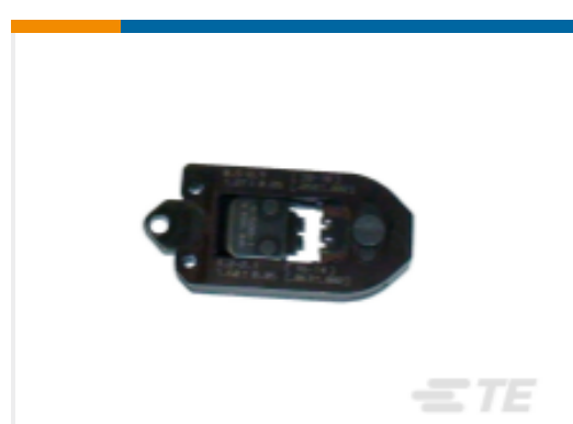
TE 产品编号91506-3 CCII UNML UNML II PIN SKT 16-14 HEAD