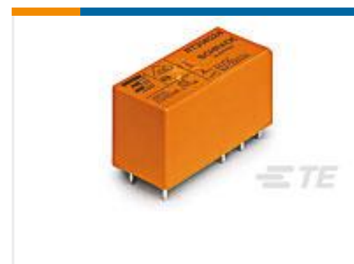
TE 产品编号4-1419136-4 RT423048