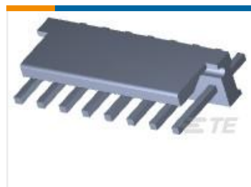
TE 产品编号3-644759-8 08P MTA156 HDR ASSY STR LF