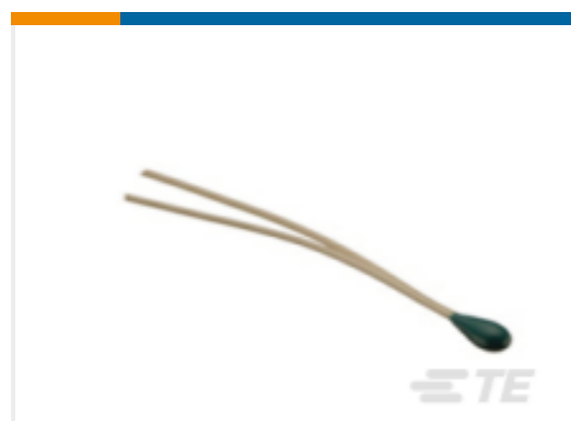
TE 产品编号GA30K6A11B DISCRETE 30K OHMS,+/-0.2C FROM 0C TO 70C