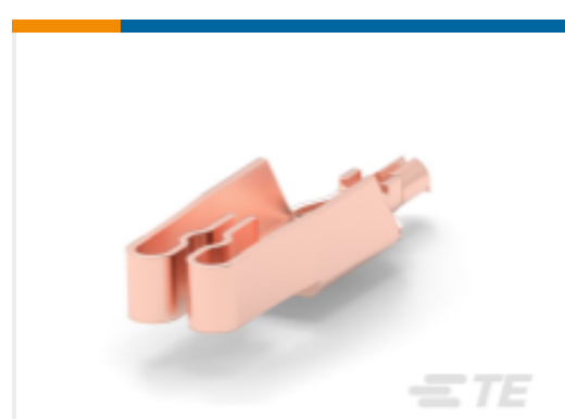
TE 产品编号5-531355-3 HIGH CURRENT LOOSE PIECE