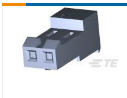
TE 产品编号3-640472-2 02P MTA156 ASSY ON TAPE LF