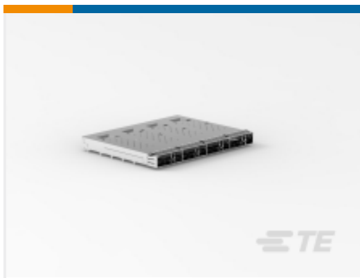
TE 产品编号2170744-4 CAGE ASSEMBLY, 1X4, QSFP28, SPRING