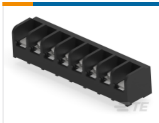
TE 产品编号1437658-3 8PCV-06-410=8PCV-06 W/MTG.