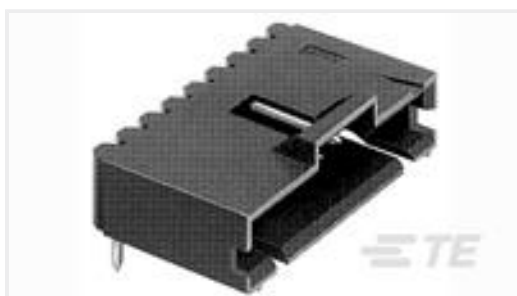
TE 产品编号7-103635-3 24 MTE HDR SRRA LTCH.100CL LF