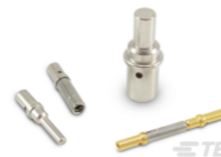
TE 产品编号0462-209-16141 DEUTSCH Solid Contacts