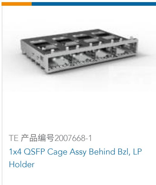
TE 产品编号2007668-1 1x4 QSFP Cage Assy Behind Bzl, LP Holder