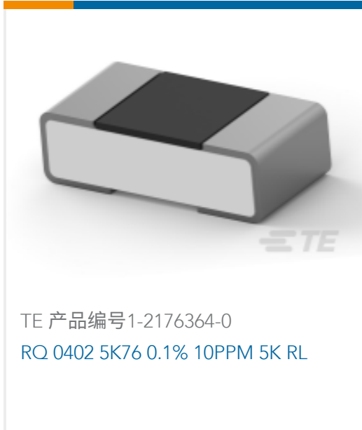
TE 产品编号1-2176364-0 RQ 0402 5K76 0.1% 10PPM 5K RL