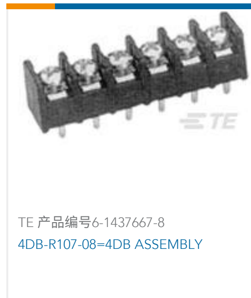
TE 产品编号6-1437667-8 4DB-R107-08=4DB ASSEMBLY