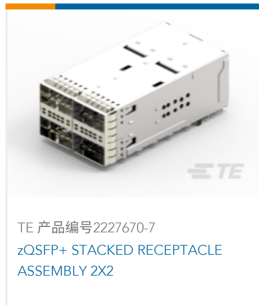
TE 产品编号2227670-7 zQSFP+ STACKED RECEPTACLE ASSEMBLY 2X2