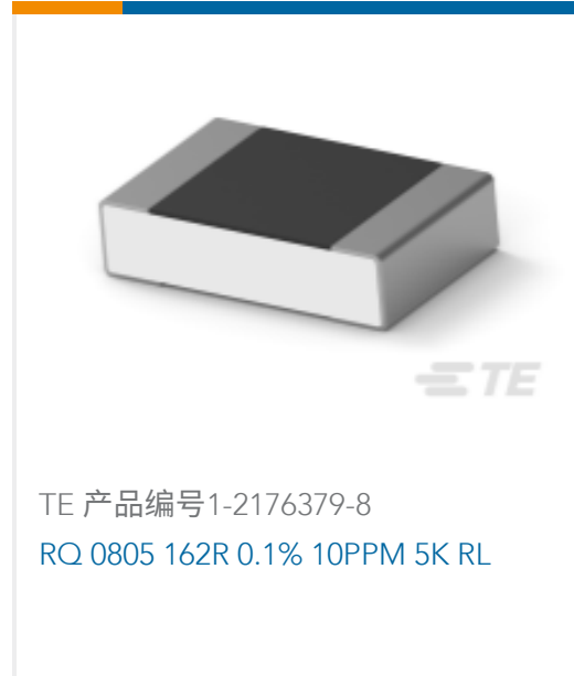
TE 产品编号1-2176379-8 RQ 0805 162R 0.1% 10PPM 5K RL