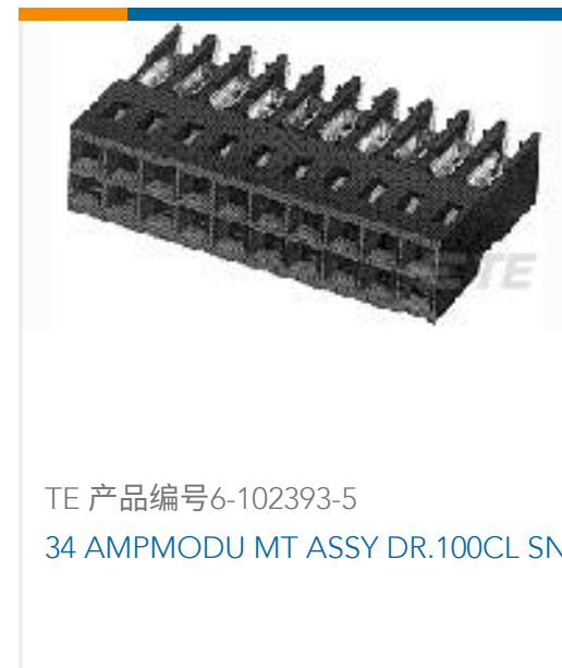
TE 产品编号6-102393-5 34 AMPMODU MT ASSY DR.100CL SN