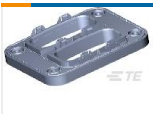
TE 产品编号1813123-1 ASSY FOR SUPPORT PLATE AND SEALING