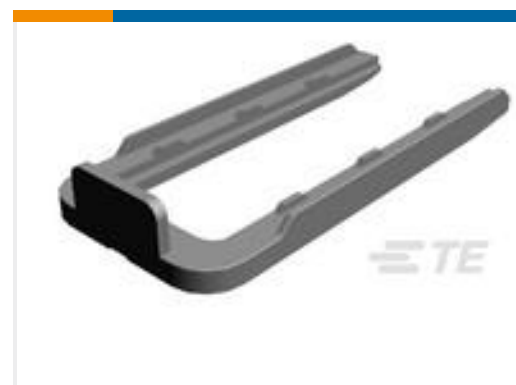
TE 产品编号1718328-1 FIXING SLIDE