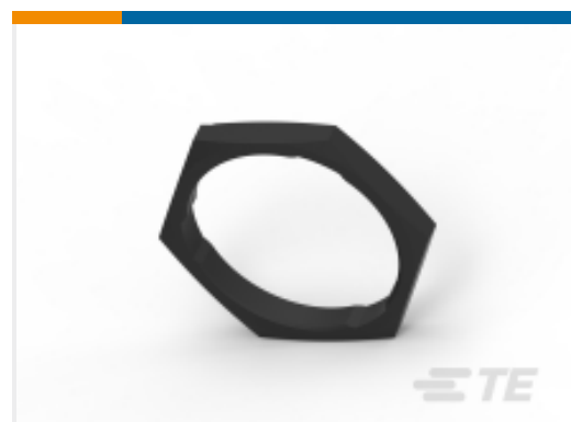
TE 产品编号2411-001-2405 PANEL NUT, SIZE 24, HDP