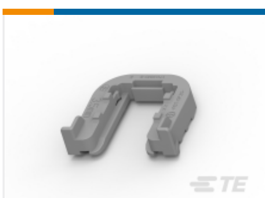
TE 产品编号1703810-6 SLIDE, TAB HSG GROUP B