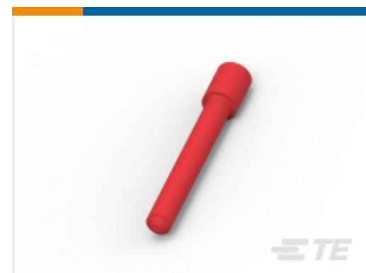
TE 产品编号0413-204-2005 SEALING PLUG, SIZE 20, RED