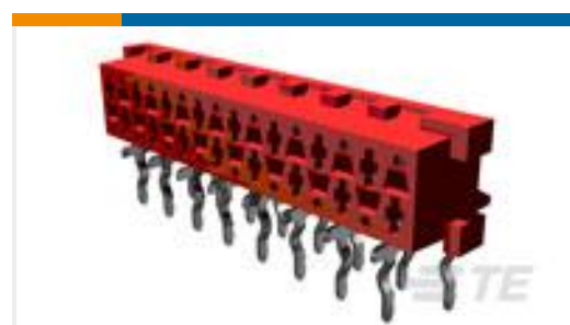
TE 产品编号2-215460-0 MICRO-MATCH FEM.SE