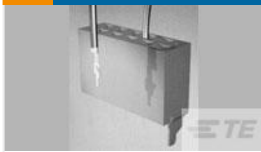
TE 产品编号 2-338095-0 MICRO-MATCH COSI HSG