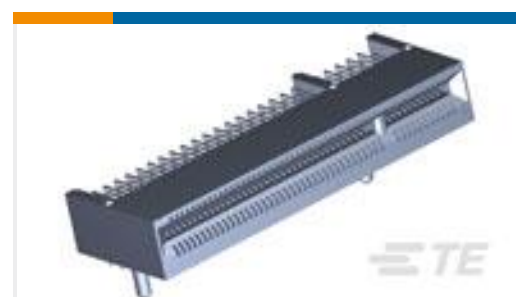
TE 产品编号2-1761465-2 PCI Express RA assy 5.8mm slot 2.3 mm pc