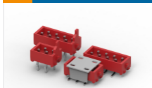
TE 产品编号 CAT-M5833-M2934 Male-on-Board Connector, Micro-MaTch