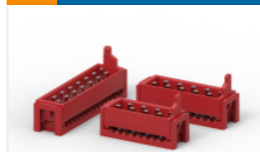
TE 产品编号 CAT-M5833-M2934A Male-on-Wire Connector, Micro-MaTch