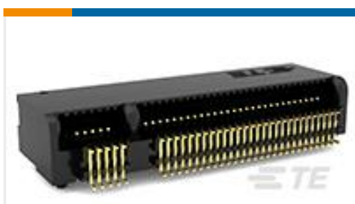
TE 产品编号2199230-8 M.2.0.5PITCH 4.2H KEY A 15U" AU