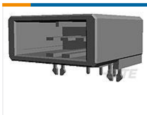
TE 产品编号2-2013519-0 DYNAMIC D3900 H-HDR ASSY 10P Y TYPE-A