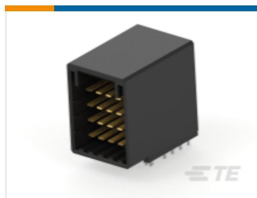
TE 产品编号2-178216-2 Dynamic 3400F HDR 组件