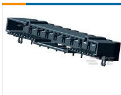
TE 产品编号1-2229803-2 D3950 HDR 7/11POS 1ROW Y KEY