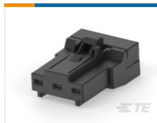
TE 产品编号3-2134249-3 D3900S 7.5MM PITCH REC ASSY 3P BLACK Z