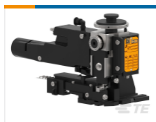
TE 产品编号2837892-2 OCEAN-2.0-APPLICATOR-S-046F053F