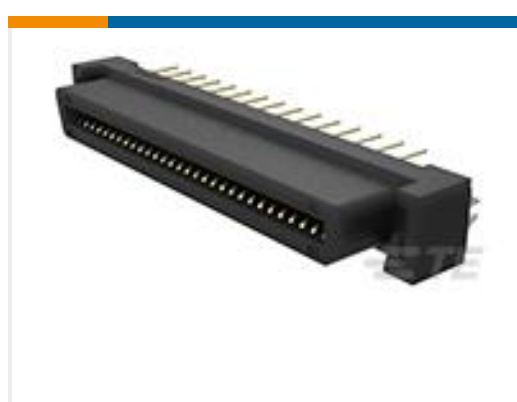
TE 产品编号3-5175475-7 CHAMP 050 B/B REC V W/LEG 60P