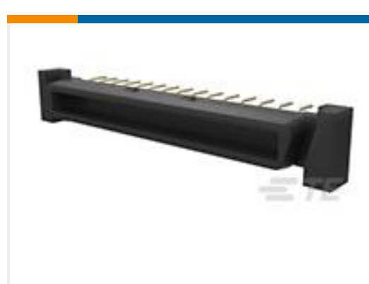
TE 产品编号5917629-5 AMP FH REC V 120P H-9 SIF