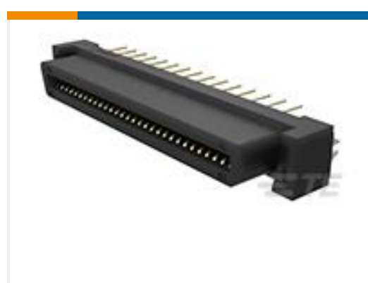
TE 产品编号3-5175475-5 CHAMP 050 B/B REC V W/LEG 40P