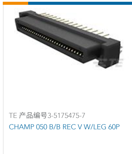
TE 产品编号3-5175475-7 CHAMP 050 B/B REC V W/LEG 60P