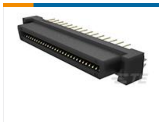
TE 产品编号3-5175475-5 CHAMP 050 B/B REC V W/LEG 40P