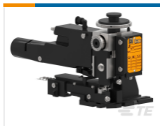
TE 产品编号2837892-2 OCEAN-2.0-APPLICATOR-S-046F053F