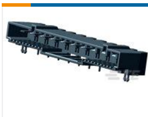
TE 产品编号1-2229803-2 D3950 HDR 7/11POS 1ROW Y KEY