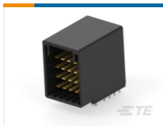
TE 产品编号3-178216-2 Dynamic 3400F HDR 组件