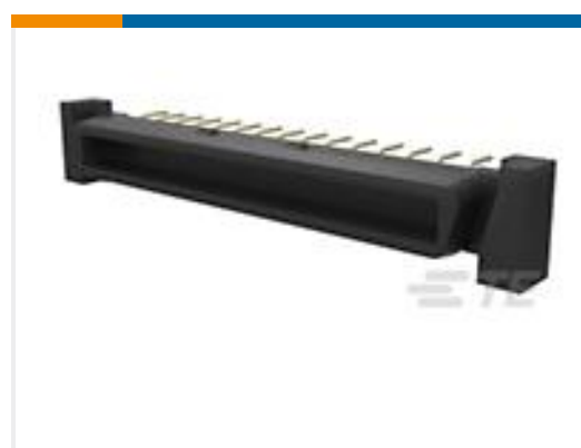
TE 产品编号5917629-5 AMP FH REC V 120P H-9 SIF