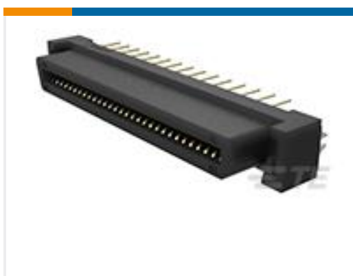
TE 产品编号3-5175475-7 CHAMP 050 B/B REC V W/LEG 60P