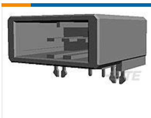
TE 产品编号2-2013519-0 DYNAMIC D3900 H-HDR ASSY 10P Y TYPE-A