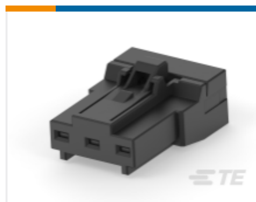
TE 产品编号3-2134249-3 D3900S 7.5MM PITCH REC ASSY 3P BLACK Z