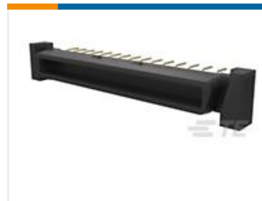
TE 产品编号5917629-5 AMP FH REC V 120P H-9 SIF