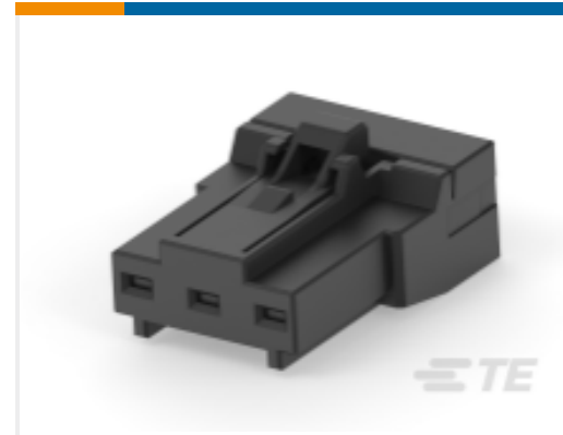
TE 产品编号3-2134249-3 D3900S 7.5MM PITCH REC ASSY 3P BLACK Z