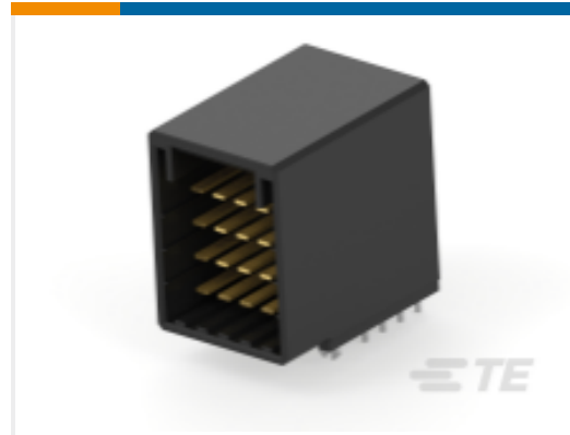
TE 产品编号2-178216-2 Header Assembly: Wire-to-Board, 15A, gold or tin plated