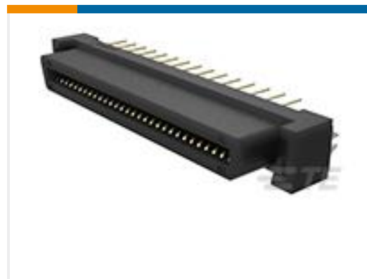
TE 产品编号3-5175475-5 CHAMP 050 B/B REC V W/LEG 40P