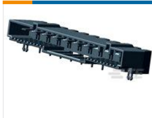
TE 产品编号1-2229803-2 D3950 HDR 7/11POS 1ROW Y KEY