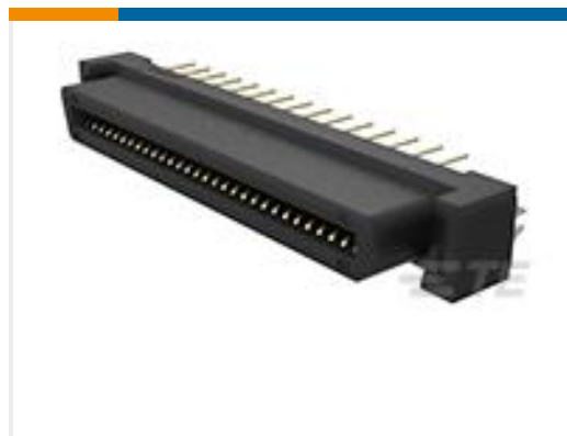
TE 产品编号3-5175475-7 CHAMP 050 B/B REC V W/LEG 60P