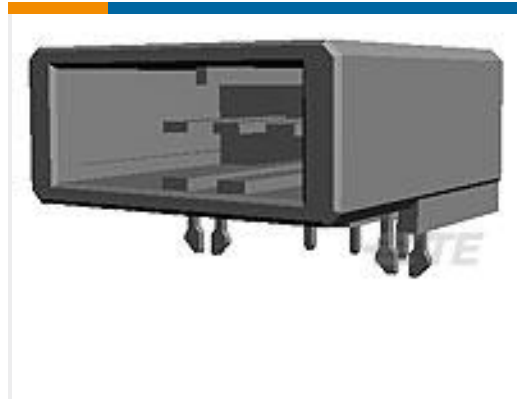
TE 产品编号2-2013519-0 DYNAMIC D3900 H-HDR ASSY 10P Y TYPE-A