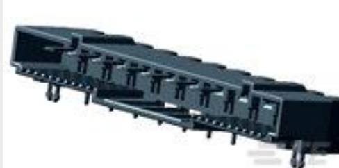
TE 产品编号1-2229803-2 D3950 HDR 7/11POS 1ROW Y KEY