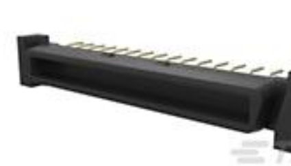
TE 产品编号5917629-5 AMP FH REC V 120P H-9 SIF