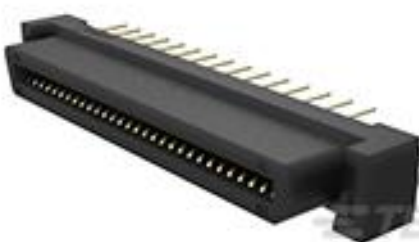
TE 产品编号3-5175475-5 CHAMP 050 B/B REC V W/LEG 40P