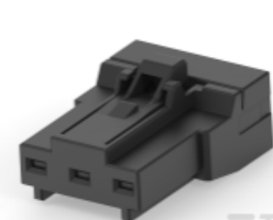
TE 产品编号3-2134249-3 D3900S 7.5MM PITCH REC ASSY 3P BLACK Z