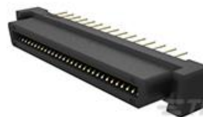
TE 产品编号3-5175475-7 CHAMP 050 B/B REC V W/LEG 60P