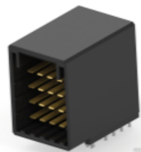
TE 产品编号2-178216-2 Dynamic 3400F HDR 组件