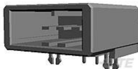
TE 产品编号2-2013519-0 DYNAMIC D3900 H-HDR ASSY 10P Y TYPE-A