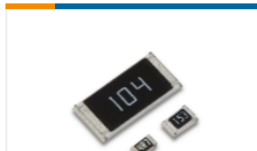
TE 产品编号2176347-6 CRGCQ 2010 27R 1%