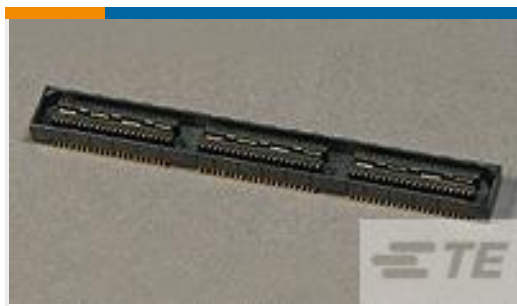
TE 产品编号2-1658012-3 MSB0.80RC-ASY120FL,-,10,-TY