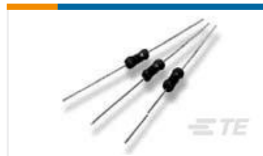
TE 产品编号9-1879352-1 RR02 5% 1K8 AMMO