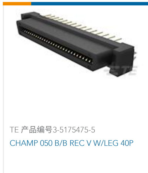
TE 产品编号3-5175475-5 CHAMP 050 B/B REC V W/LEG 40P