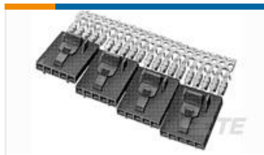
TE 产品编号5-103961-4 4X5 MTE RCPT SR LATCH .100CL