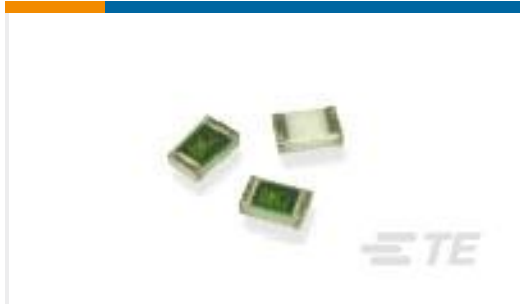
TE 产品编号2176087-5 RP 1J 0.166W 75R 0.1% 25PPM 1K RL