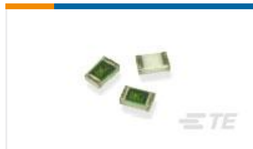
TE 产品编号7-2176092-0 RP 2A 0.25W 4K02 0.1% 25PPM 1K RL