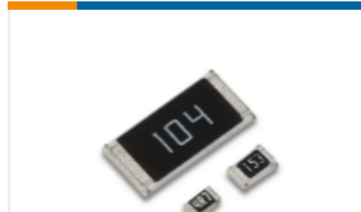
TE 产品编号2176347-6 CRGCO 2010 27R 1%