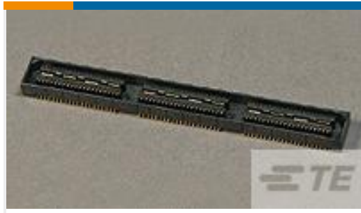
TE 产品编号2-1658012-3 MSB0.80RC-ASY120FL,-,10,-TY