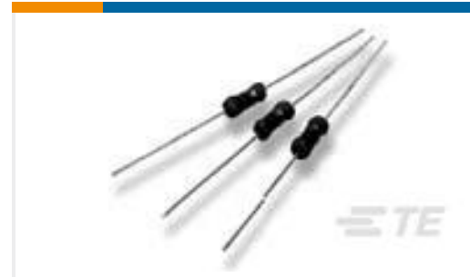
TE 产品编号9-1879352-1 RR02 5% 1K8 AMMO