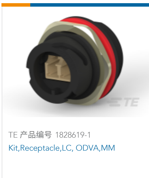
TE 产品编号 1828619-1 Kit,Receptacle,LC, ODVA,MM