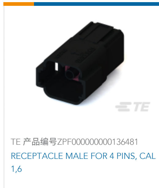
TE 产品编号ZPF000000000136481 RECEPTACLE MALE FOR 4 PINS, CAL 1,6