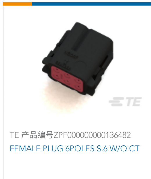
TE 产品编号ZPF000000000136482 FEMALE PLUG 6POLES S.6 W/O CT