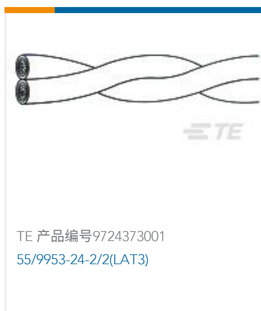
TE 产品编号9724373001 55/9953-24-2/2(LAT3)