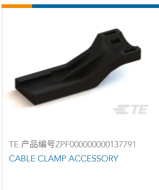
TE 产品编号ZPF000000000137791 CABLE CLAMP ACCESSORY