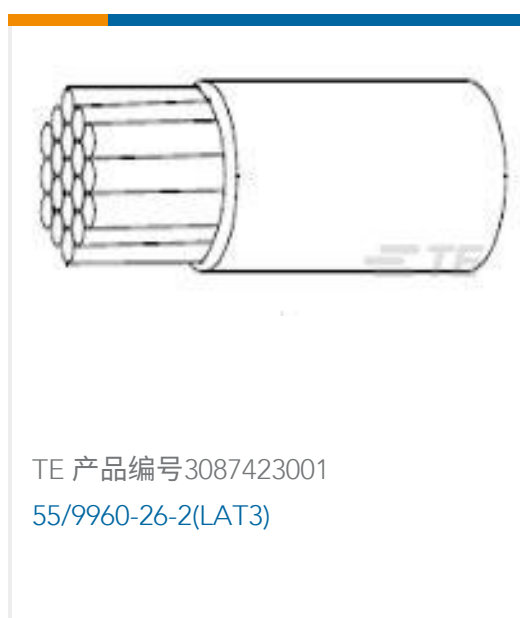
TE 产品编号3087423001 55/9960-26-2(LAT3)