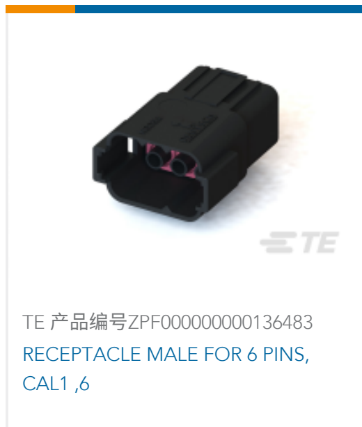
TE 产品编号ZPF000000000136483 RECEPTACLE MALE FOR 6 PINS, CAL1,6