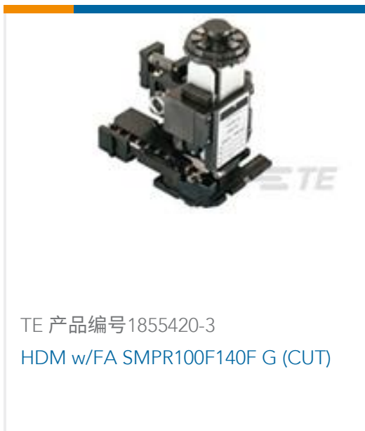
TE 产品编号1855420-3 HDM w/FA SMPR100F140F G (CUT)