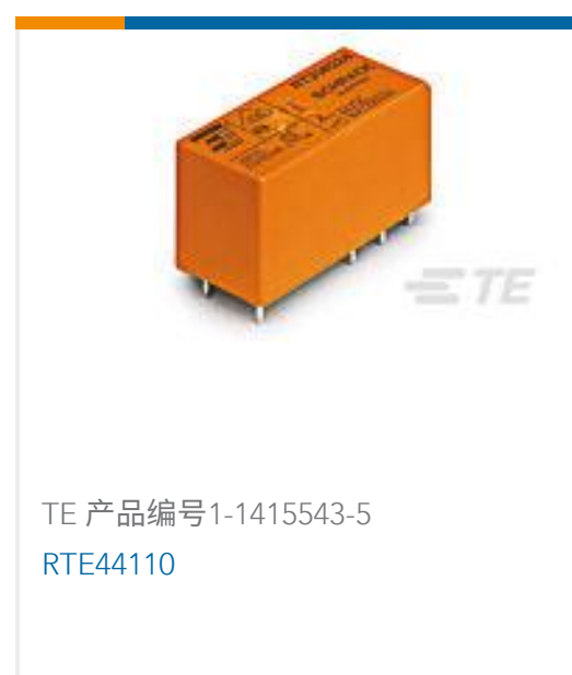
TE 产品编号 1-1415543-5 RTE44110