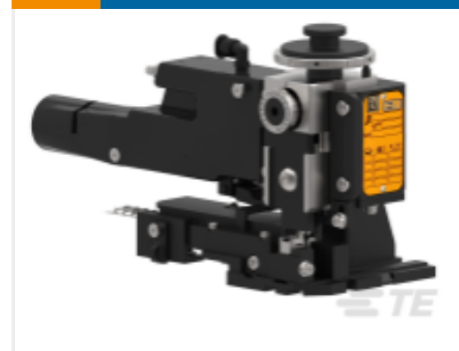
TE 产品编号 2151720-2 OC-AT-S-FA-080F138F-001-0239