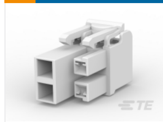
TE 产品编号 1983659-1 4P Plug Housing