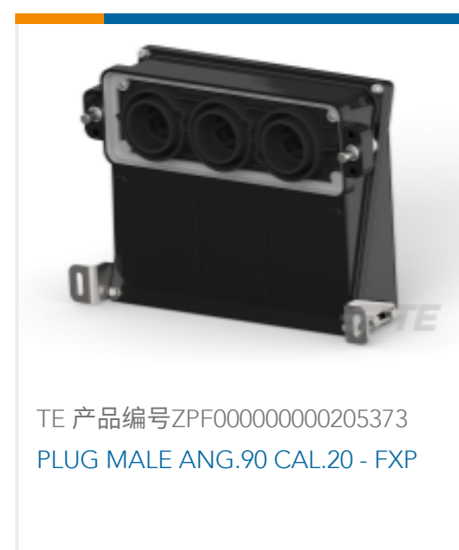
TE 产品编号 ZPF00000000205373 PLUG MALE ANG.90 CAL.20 - FXP