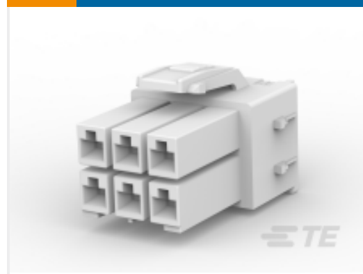
TE 产品编号 CAT-P87024-P729A 灼热丝电源双锁插头