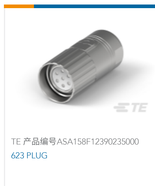
TE 产品编号 ASA158F12390235000 623 PLUG