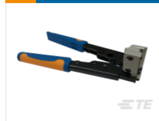
TE 产品编号 2305570-1 Strip Terminal Cutter-Side Feed-No Crimp