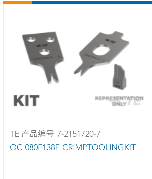
TE 产品编号 7-2151720-7 OC-080F138F-CRIMPTOOLINGKIT