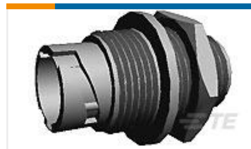
TE 产品编号1445421-3 REC,8-4,FLNG MT,LG INS,STD KEY