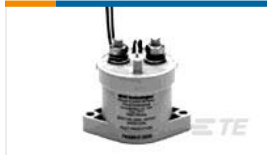
TE 产品编号1618002-5 EV200AAACA=RELAY, EV200 SPST-N