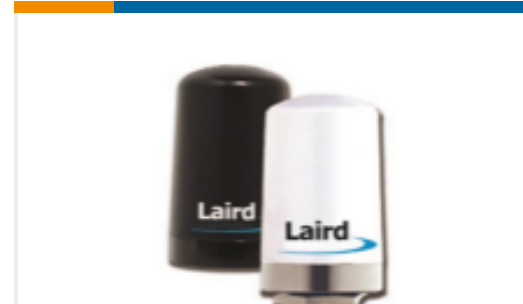
TE 产品编号TRA9023P OMNI,SB,Ph,902-928MHZ 3,PMT