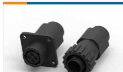
TE 产品编号796271-1 One-Piece Connector, Sealed, CPC Series 1