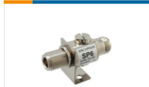
TE 产品编号SP6-230-BFM Surge,GasWB,DC-6GHz,NFB NM,230V