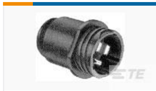
TE 产品编号206137-2 23-7 FREE HANGING RECEPT