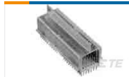
TE 产品编号646502-1 2MM HM DUST PROTECTOR TYPE A /B