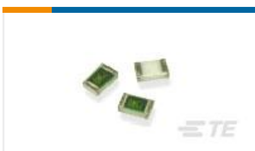
TE 产品编号2176093-5 RP 2A 0.25W 10K 0.1% 25PPM 1K RL