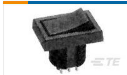
TE 产品编号1825421-1 TRD23N10WL04 rocker switch