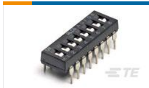
TE 产品编号1825002-5 ADF0404=DIP SWT,FLUSH,THRU/HL