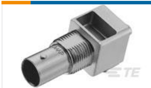
TE 产品编号5222092-1 JACK,RTANG,PCB,75 OHM,BNC