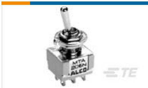
TE 产品编号4-1437559-6 MTM106DPC=SW TOG SHORT LEVER P