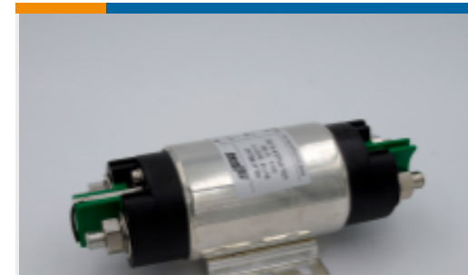
TE 产品编号K1021599 Relay 29-221-12