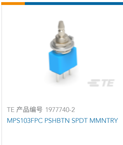
TE 产品编号 1977740-2 MPS103FPC PSHBTN SPDT MMNTRY