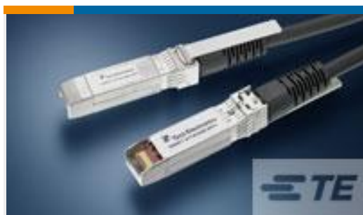
TE 产品编号2127933-1 C/A, SFP+, GENERIC, 0.5M