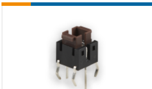
TE 产品编号6-2213818-1 6X6 ILL TACT THT 520GF HI SOFT ORANGE