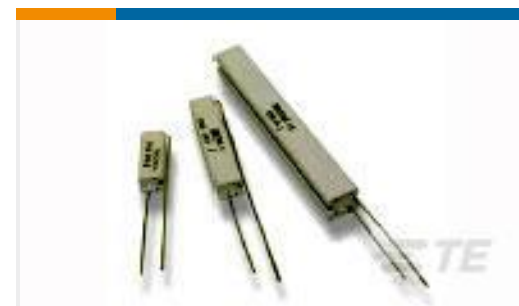
TE 产品编号1623723-2 SBCH 15 1K5 5%