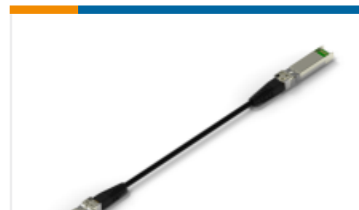
TE 产品编号2821224-7 SFP28 DIRECT ATTACH CA, 4M, 26AWG