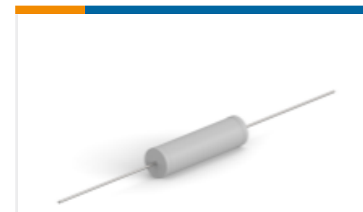
TE 产品编号3-2176414-4 7W STD M/OX 5% 470R