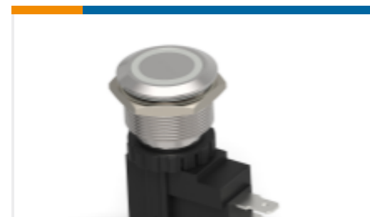
TE 产品编号2-2364686-8 AVH22 FLT SS LK RNG R&B 24V16A