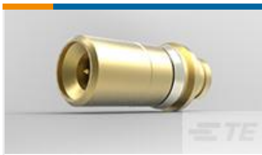
TE 产品编号2101012-1 SMPM STR CABLE PLUG