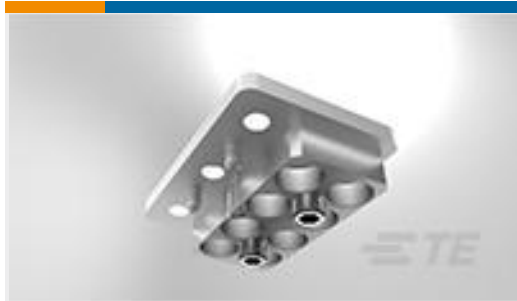
TE 产品编号2157553-1 RF BACKPLANE MODULE 8 POS