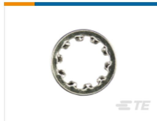
TE 产品编号WS-SMA-N Washer Nickel SMA Connector RoHS