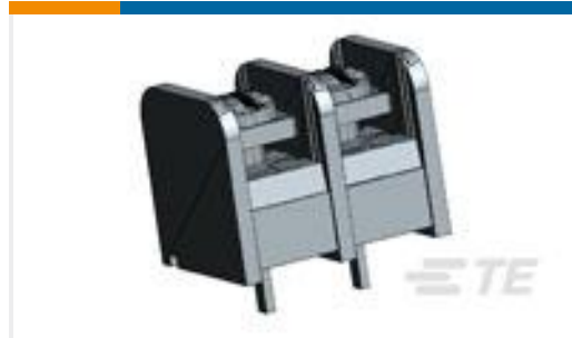
TE 产品编号3-1437664-0 NC6-P108-02=NC6 ASSEMBLY