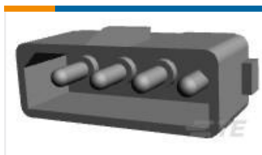
TE 产品编号350543-1 04P CMNL HDR ASSY SHORT NATL