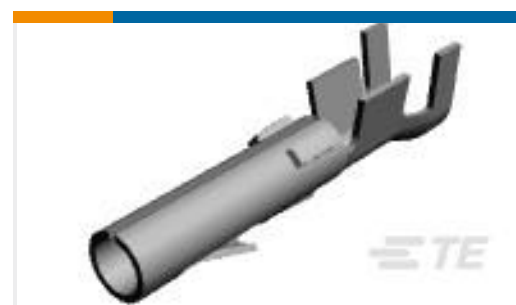
TE 产品编号60619-5 CMNL SOK AUBR L/P