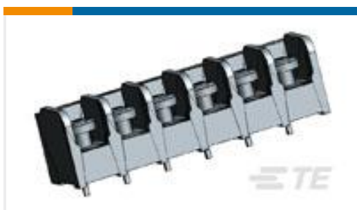
TE 产品编号9-1437657-8 8PCV-06-006=#8 TRIBARRIER