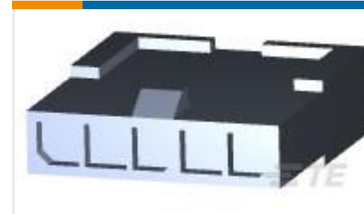
TE 产品编号1445049-5 FREE HANG SNGL ROW HSG 5 POS