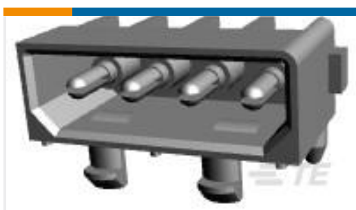
TE 产品编号770846-1 04P CMNL HDR ASSY R/A BLK HT