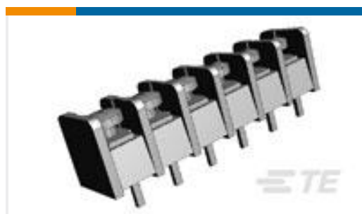
TE 产品编号1-1437667-2 4DB-P107-06=4DB ASSEMBLY