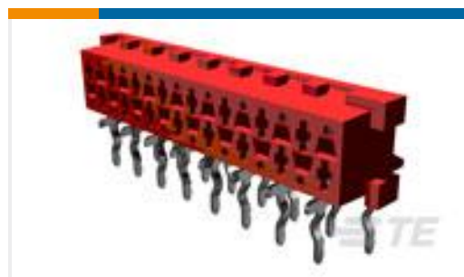
TE 产品编号8-215460-0 MICRO-MATCH FSID P