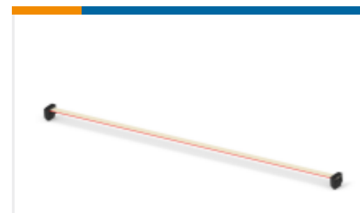
TE 产品编号173801-E IDCCS SMC 1,27 12 * AU AUI 300 PVC