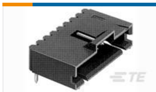
TE 产品编号5-103635-4 05 MTE HDR SRRA LTCH.100CL LF