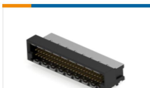
TE 产品编号374722-E MSPEED 50 M SMDTHR * 90BE AB VV 137 094