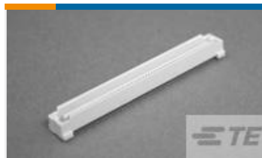
TE 产品编号5177986-2 0.8FH,P05H.5,060,08/Sn,TR,SC