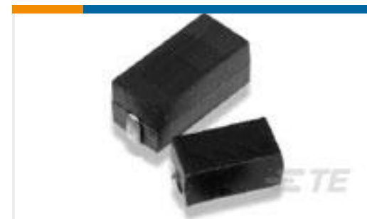
TE 产品编号3-1879233-7 SMW5 3R3 5%