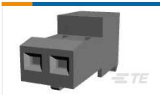
TE 产品编号3-641535-2 02P MTA100 CONN ASSY LF