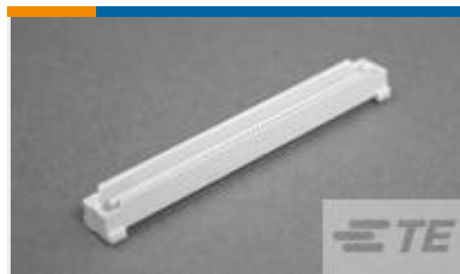
TE 产品编号5177986-5 0.8FH,P05H.5,120,08/Sn,TR,SC