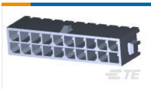
TE 产品编号5-794630-0 20P MICRO MNL ASSY,VRT,HDR,LF