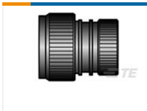
TE 产品编号527781-000 HEX40-AC-00-15-A5-1