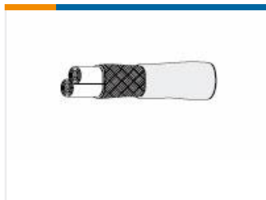
TE 产品编号272103-000 55A1123-20-9/96-9CS2275